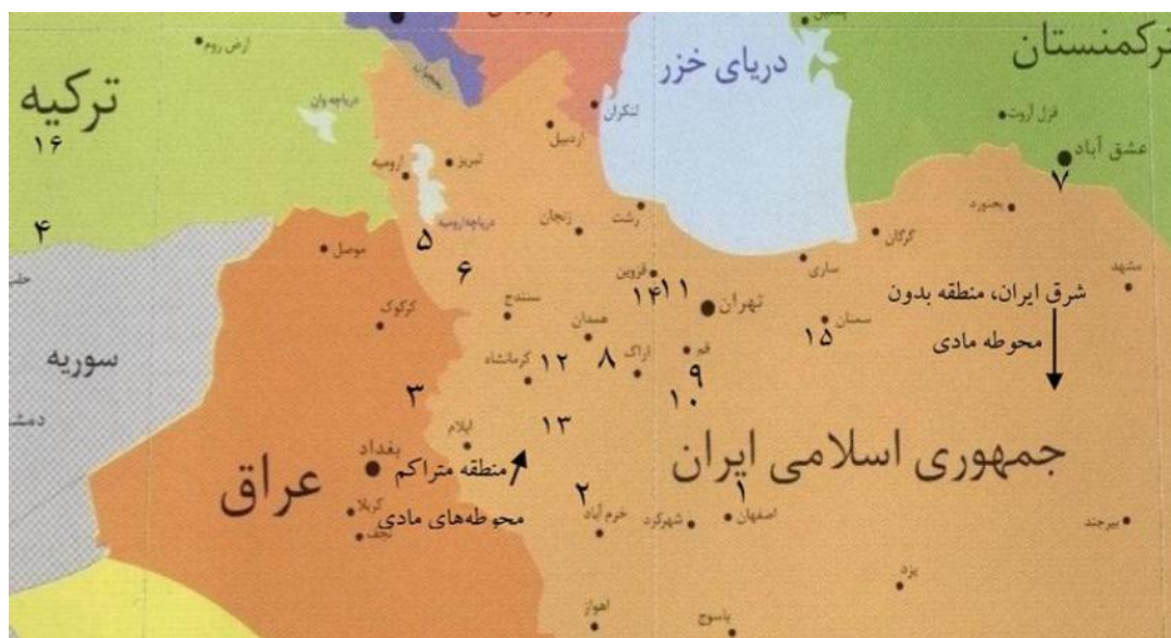
نقشه ۲: پراکنندگی محوطه‌های شاخص دوره ماد بر اساس کاوش‌های باستان‌شناسی (جمور ۱۳۸۶: ۵) ترسیم: نگارنده ۱- سیلک ۲- بابا جان ۳- تل قبه ۴- هویوک تپه ۵- حسنلو ۶- زیویه ۷- الغ تپه ۸- نوشیجان تپه ۹- صرم ۱۰- واسون ۱۱- خوروین ۱۲- گودین تپه ۱۳- بابا جان ۱۴- تپه ازبکی ۱۵- دلایان سمنان ۱۶- کرکنس داغ