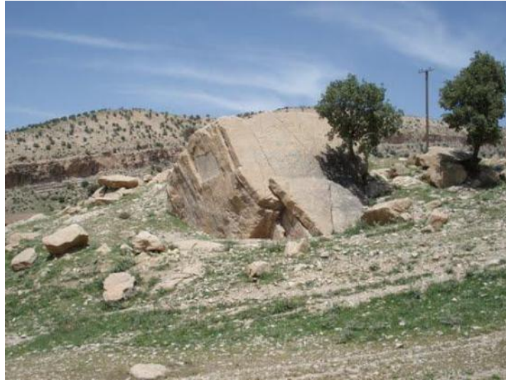
تصویر ۹: کتیبه تخت خان.