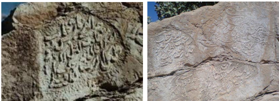
تصویر ۱۲: کتیبه نخجیر یا سر تزن (نگارندگان ۱۳۸۹).