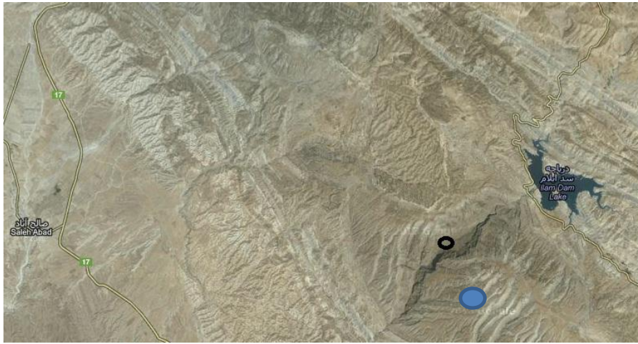
تصویر ۱۰: موقعیت کتیبه نخجیر یا سر تزن.