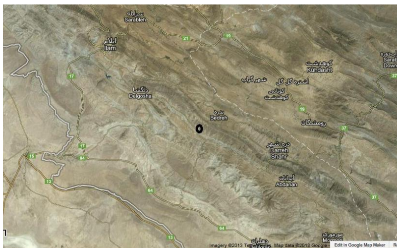
تصویر ۱۳: موقعیت کتیبه میمه.