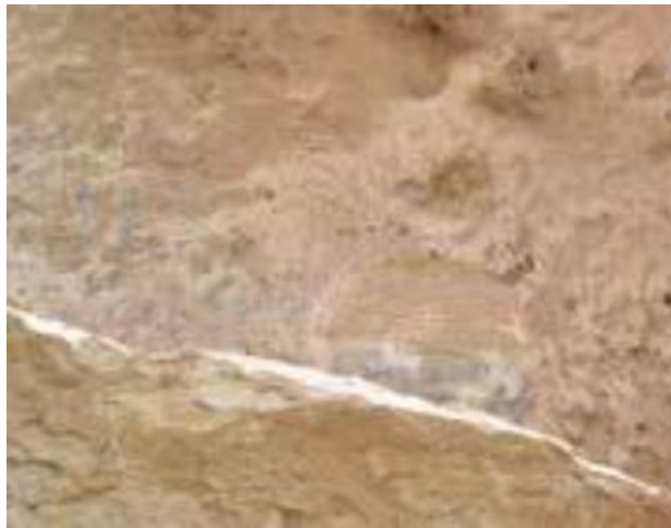
تصویر ۷: سنگ‌نوشته قلعه والی ایلام (افشار سیستانی ۱۳۷۲).