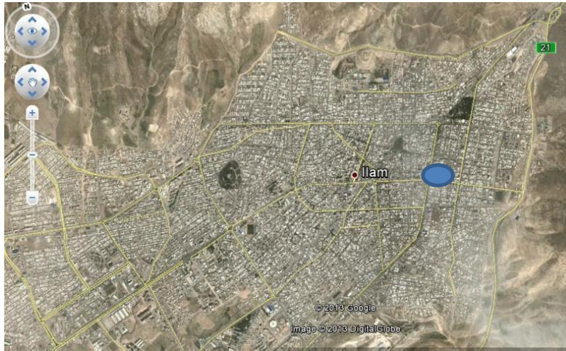
تصویر ۶: سنگ‌نوشته قلعه والی ایلام.