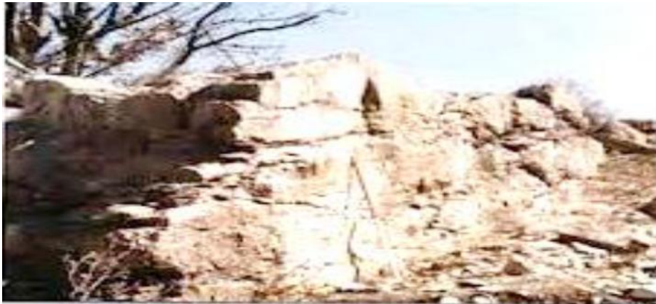
تصویر ۱۱: کتیبه نخجیر یا سر تزن.