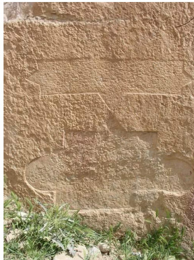
تصویر ۵: سنگ‌نوشته تنگ قوجعلی.