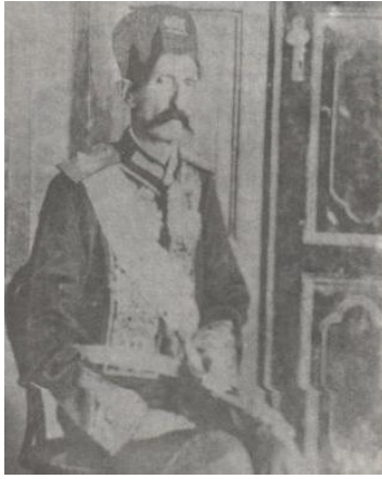
تصویر ۳: غلامرضا خان والی (افشار سیستانی ۱۳۷۲).