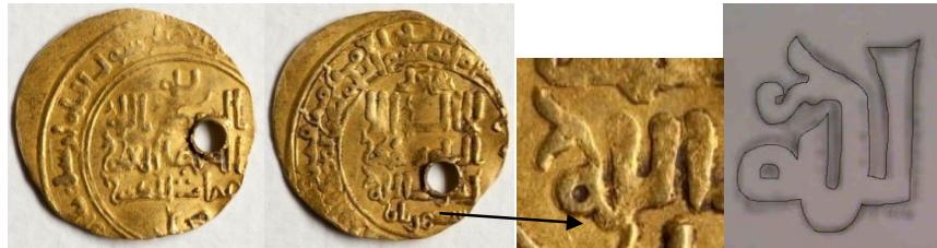
تصویر ۱۴: از سمت راست: نمونه‌ای از خط کوفی گلدار (گرومن، ۱۳۸۳: ۹). سمت چپ: نمونه‌ای از دینار سلجوقی، ضرب سال ۵۰۴ ه.ق. (موزه ملک: ۳۰۰)