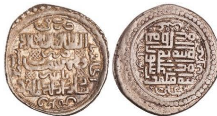
تصویر ۲۶: سکه‌ای از ابوسعید، ضرب شیروان (ANS, Islamic Department: 1922.216.400)