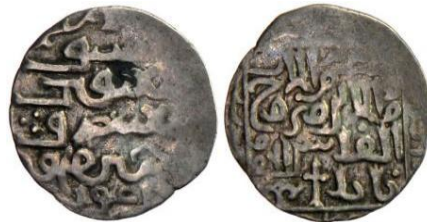
تصویر ۲۴: سکه‌ای از ارغون، با نقش صلیب و شعار تثلیث، ضرب تفلیس ( www.stevealbum.com )