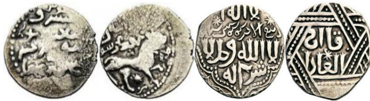
تصویر ۲۳: سکه‌هایی از آباقاخان با نفوذ اقلیت‌ها مذهبی: ستاره داوود، خط اویغوری، شیر و خورشید