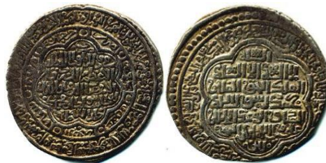
تصویر ۲۵: سکه‌هایی از اولجایتو، ضرب جرجان، سال ۷۱۴ ه.ق.، با شعار "لااله الاالله محمد رسول الله علی ولی الله" (ANS, Islamic Department: 1937.1.8)