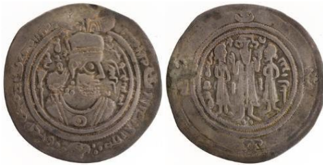
تصویر ۳: سکه‌ای از بشر بن مروان، ضرب کوفه (ANS, Islamic Department: 1983.14.1)