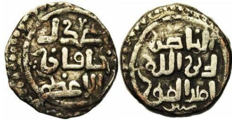
تصویر ۲۲: سکه‌ای از چنگیز خان، نمونه‌ای از ضرب کلمات فارسی بر سکه (موزه ملک: 5000.06.00581)