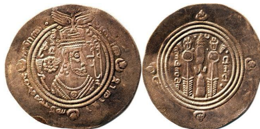
تصویر ۲: سکه‌ای از حجاج بن یوسف، ضرب اردشیر خوره