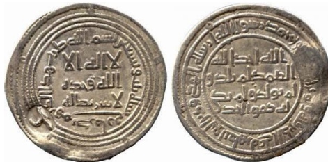
تصویر ۵: درهم اموی، ضرب کرمان، سال ۹۳ ه.ق. (Baldwin's Auctions.: Islamic Coin Auc 23: lot 85)