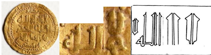
تصویر ۱۷: تصویر سمت راست: انتهای الف‌ها و لام‌ها به دو طرف برگشته است. تصویر سمت چپ: دینار سلجوقی، ضرب شیراز، سال ۴۸۸ ه.ق. (موزه ملک: ۲۹۱)