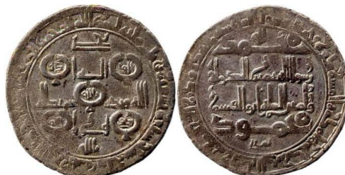
تصویر ۱۲: نمونه‌ای از درهم غزنوی، محمود، ضرب بلخ، سال ۳۹۶ ه.ق.