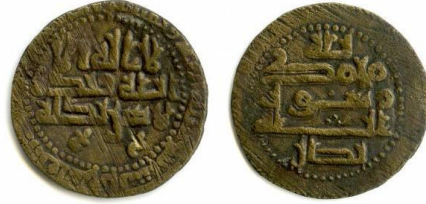
تصویر ۱۳: سکه‌ای مسی از نصرین احمد سامانی، ضرب الشاش، سال ۲۵۴ ه.ق. (zeno.ru: 36176)، خط کوفی برگ‌دار یا گلدار