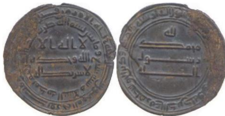
تصویر ۷: درهمی ضرب مدینه‌السلام، سال ۲۰۷ ه.ق. (Fitzwilliam Museum, 104623)