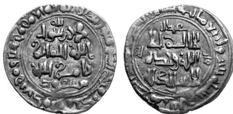
تصویر ۱۱: نمونه‌ای از درهم غزنوی، مسعود، ضرب بلخ، سال ۴۳۰ ه.ق.