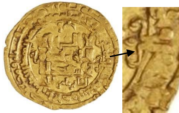
تصویر ۱۵: در این سکه ادامه حروف "ی" در کلمه اثنی و "واو" به صورت پیچکی و طوماری ضرب شده است (ANS, Islamic Department: 1967.261.7)