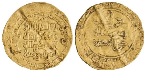
تصویر ۹: دیناری از المستنجد خلیفه عباسی، ضرب مدینه‌السلام، سال ۵۶۱ ه.ق.