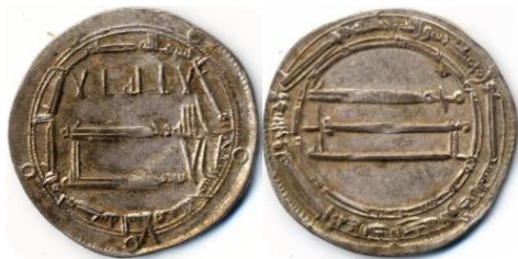
تصویر ۶: سکه‌ای از هارون الرشید: سال ۱۷۵ ه.ق. (ANS, Islamic Department: 1972.79.425)