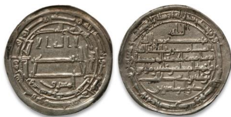
تصویر ۸: سکه‌ای مربوط به ولایتعهدی امام رضا (ع)، سال ۲۰۲ ه.ق. (David Collection Museum: C134)