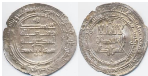
تصویر ۱۰: نمونه درهم از اسماعیل بن احمد، ضرب بلخ، سال ۲۷۲ ه.ق.، کاربرد اسلیمی در خط کوفی