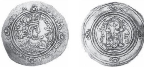
تصویر ۴: سکه‌ای متفاوت با نقش محراب و نیزه ضرب سال ۷۵ ه.ق. (Treadwell, 2005: 2)