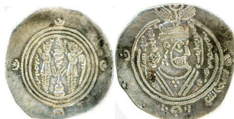
تصویر ۱: سکه‌ای از عبیدالله بن زیاد، ضرب دارابگرد